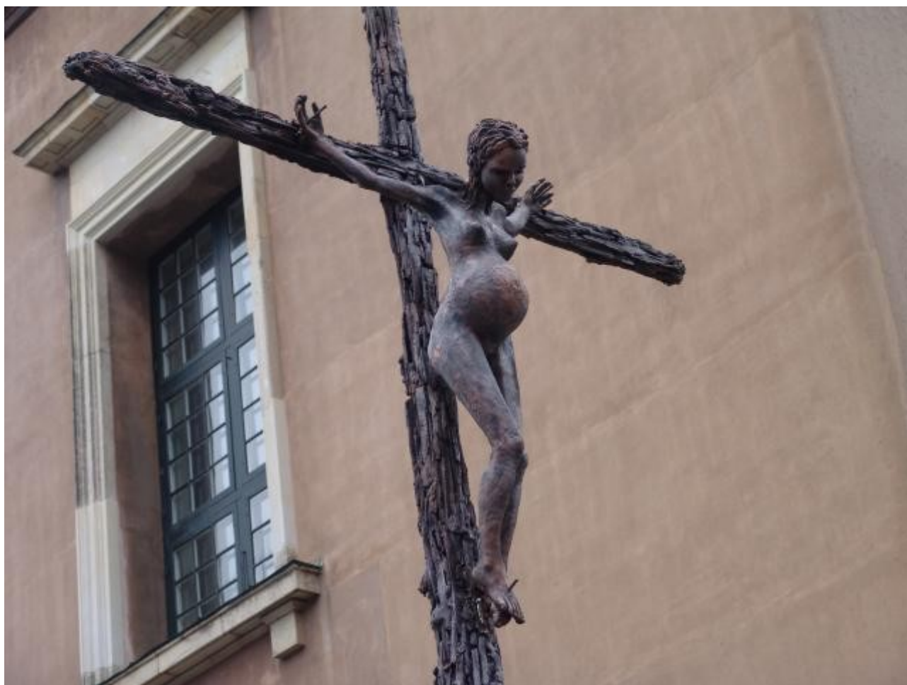
Foto: I guds navn , 2006 Mål: 160 x 160 x 40 cm Materialer: Kobber, stål af Jens Galschiøt .